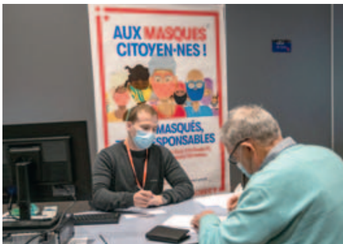
▲ Centre de vaccination de Cap Périaz.