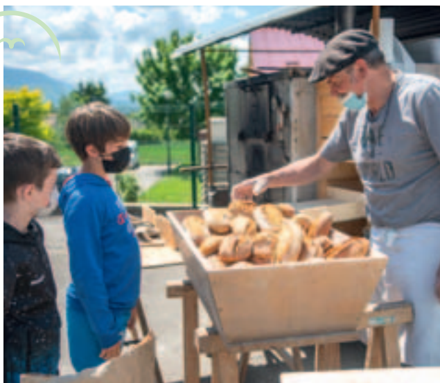
▲ Menu 100 % local le 27 mai à Pringy.