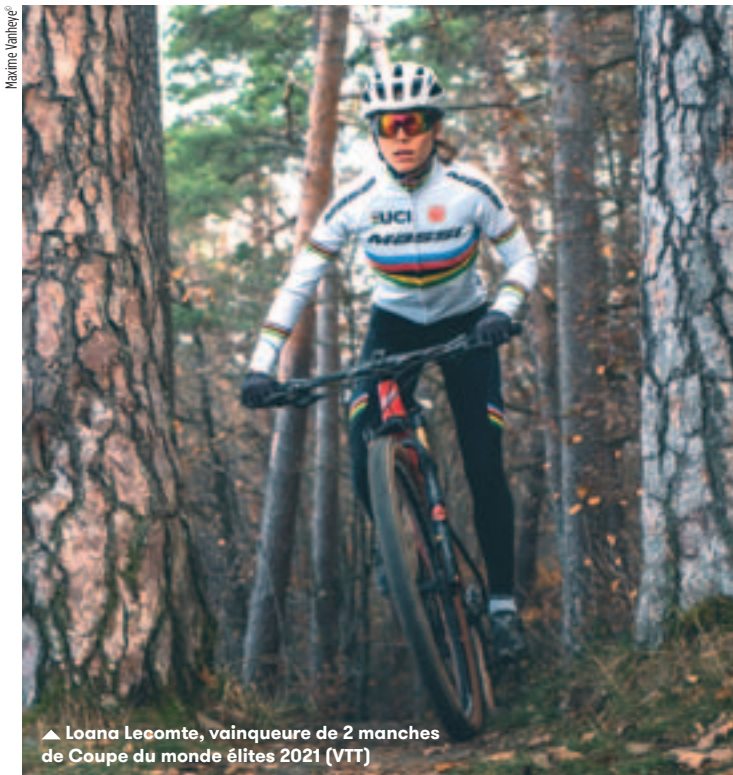
▲ Loana Lecomte, vainqueur de 2 manches de Coupe du monde élites 2021 (VTT)