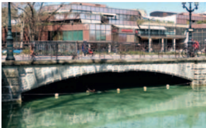
▲ Le pont Albert Lebrun

Le pont Albert Lebrun, construit en 1934, supporte les deux voies de circulation devant Bonlieu, dans le sens Marquisats-Albigny. Il nécessite aujourd'hui impérativement des travaux d'ampleur : la structure est fortement dégradée et corrodée et le dimensionnement du pont est insuffisant pour supporter les charges du trafic routier actuel. Les travaux se dérouleront après la période estivale, de septembre 2021 à mai 2022. Deux voies de circulation seront supprimées. Les deux voies restantes seront réparties entre chaque sens de circulation. Des temps de trajet allongés sont donc à prévoir même si les études d'impact sur la circulation sont optimistes. De plus, les services de la Ville travaillent en étroite collaboration avec les professionnels du transport afin de dévier et limiter le trafic de transit.