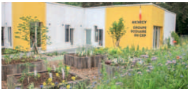
▼ La cour de l'école du CEP a été végétalisée.

Plusieurs projets sont à l'étude pour végétaliser certains lieux à tendance minérale et ainsi offrir des îlots de fraîcheur lors des fortes chaleurs estivales. À l'école de Novel, la cour va être retravaillée pendant l'hiver 2021-2022 pour proposer un meilleur confort l'été et des espaces bien différenciés (jeux, sport, repos, lecture...) afin que tous les élèves s'y sentent bien. Le projet a été mené en concertation avec trois classes de l'école pour être adapté aux besoins des enfants. À certains endroits, le bitume sera remplacé par des espaces végétaux qui permettront de rester au frais, notamment sur le temps de midi, et de profiter de la nature. L'objectif est de réaménager ainsi deux cours d'école par an. Place François de Menthon, des travaux seront menés afin d'apporter des zones d'ombre grâce à des plantations d'arbres en pleine terre et l'installation d'assises sur cette place charnière, actuellement plutôt passante. La place de la mairie de Seynod ainsi que les places Chorus et Jean-Moulin à Cran-Gevrier vont également faire l'objet d'études pour y créer plus d'espaces ombragés.