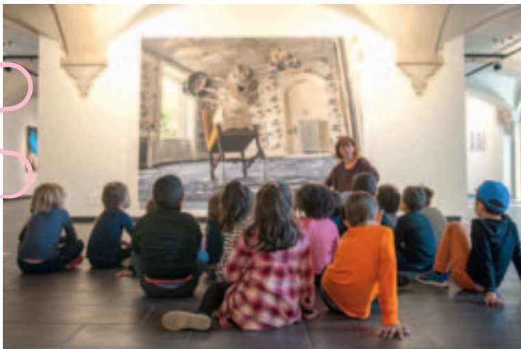
▲ Parcours d'éducation artistique et culturelle à l'Abbaye.