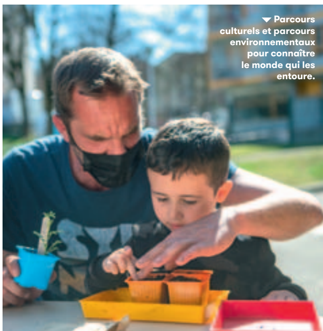
▼ Parcours culturels et parcours environnementaux pour connaître le monde qui les entoure.

Mieux connaître notre cadre de vie, la richesse et la beauté de notre environnement, la faune, la flore, la biodiversité... permet de mieux les respecter. C'est l'objectif des parcours environnementaux récemment mis en place. 25 écoles bénéficient déjà de ce nouveau dispositif. Jardins ou potagers sont ainsi créés dans les écoles avec l'aide de l'Education nationale, d'associations et de la Ville, qui fournissent le matériel – pots, tuteurs, terreaux, graines – mis à disposition du personnel pour accompagner les enfants lors des plantations. Ce lien avec la terre participe à les sensibiliser à ce que la nature leur apporte.