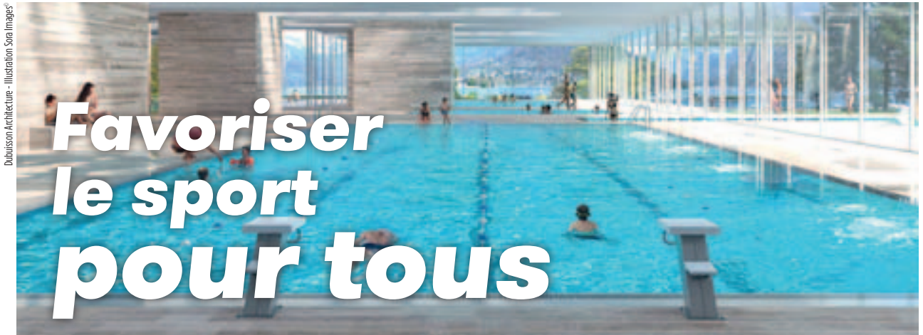
Dubousson Architecture - Illustration Soia Images