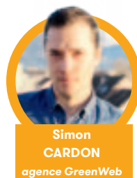
Simon CARDON agence GreenWeb

"L'application Grand Annecy Shop permet de découvrir l'offre commerciale locale en proposant une solution clés en main pour les commerçants de proximité."